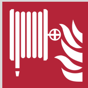
Bocas de incendio equipadas