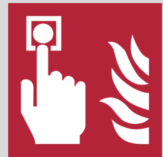
Sistemas de detección y alarma de incendios