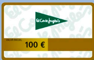
Tarjeta El Corte Inglés valor de 100 €

Tan fácil es domiciliar sus ingresos profesionales en Deutsche Bank como elegir entre 1 :