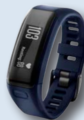
Pulsera Actividad GARMIN Vivosmart HR Notificaciones inteligentes