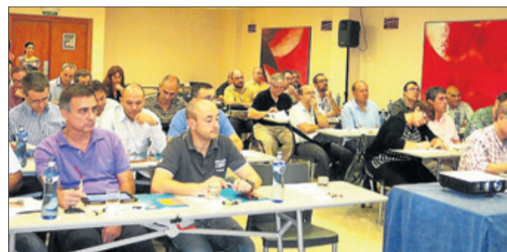
Un momento de la jornada del pasado miércoles