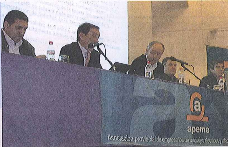
Imagen de un instante de la presentación del acuerdo comercial firmado entre ambas entidades

Esta semana se ha celebrado la Asamblea General Extraordinaria de la Asociación Provincial de Empresarios de Montajes Eléctricos y Telecomunicaciones de Alicante (APEME) en la que se ha presentado el primer acuerdo de colaboración comercial que ha suscrito Iberdrola con una organización empresarial en España para este fin. El acto tuvo lugar en el Auditorio del Palacio de Congresos de Alicante, cuyo aforo se quedó pequeño para dar cabida a los más de 550 empresarios del sector de las instalaciones eléctricas y telecomunicaciones que acudieron a la cita para conocer los detalles de este acuerdo que va a representar un mayor acercamiento de todo lo referente a la comercialización de la energía a los clientes,