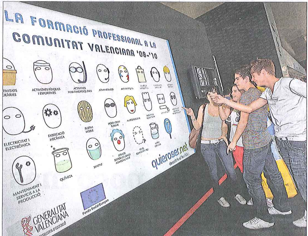
Educ@emplea se celebra en IFA hasta el próximo 14 de mayo. INFORMACIÓN

Educ@emplea va dirigido a profesionales de la docencia, estudiantes, padres, empresarios, interesados, por una parte, en la formación de sus empleados y por otra en reclutar profesionales; y personas en busca de trabajo así como a todas aquellas entidades que trabajan en temas de formación y empleo.